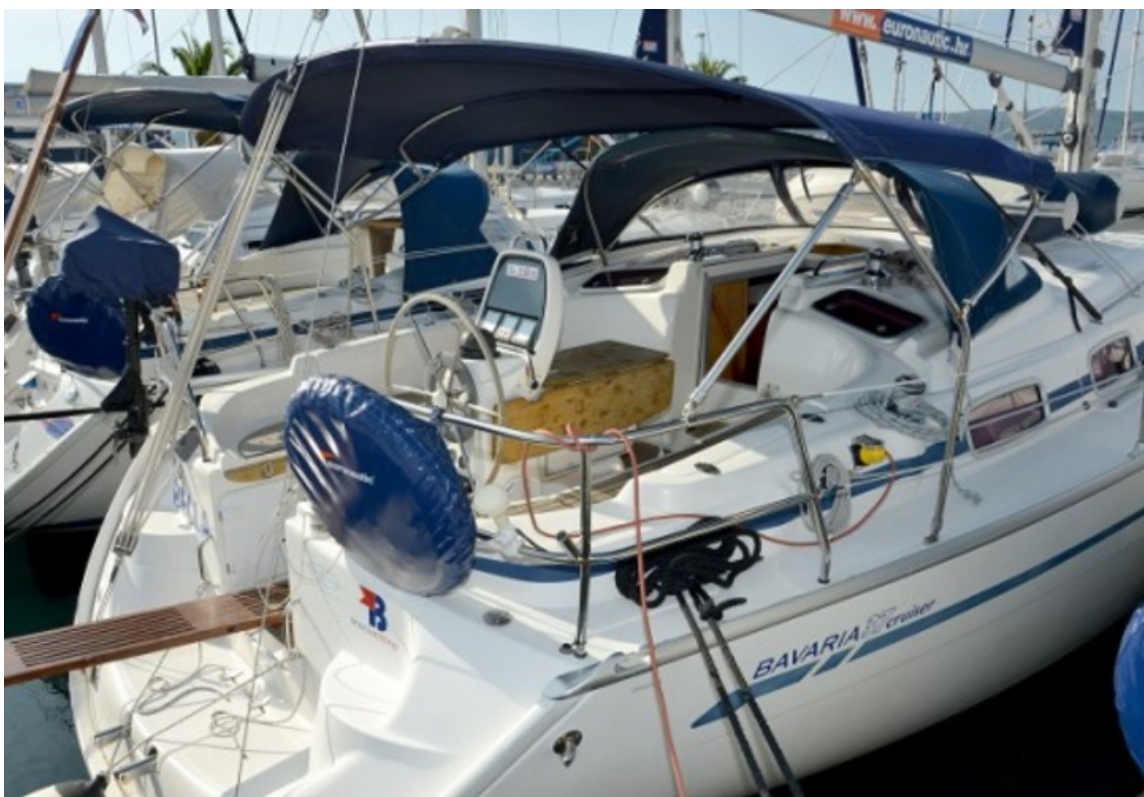
Slika preuzeta sa interneta