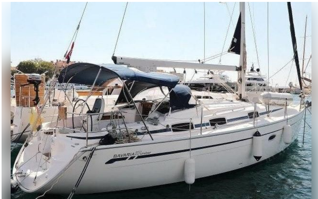
Bavaria 37 Cruiser | 2007 | 11m